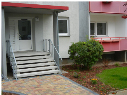
Steinstraße 7, Erdgeschoß rechts