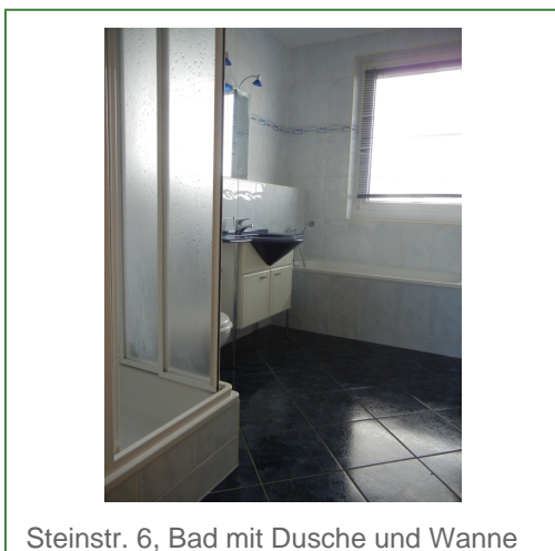
Steinstr. 6, Bad mit Dusche und Wanne